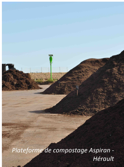
Plateforme de compostage Aspiran - Hérault

2 210 000 Français bénéficient déjà de la collecte séparée des biodéchets, ce qui permet de traiter 205 530 tonnes de biodéchets par an.